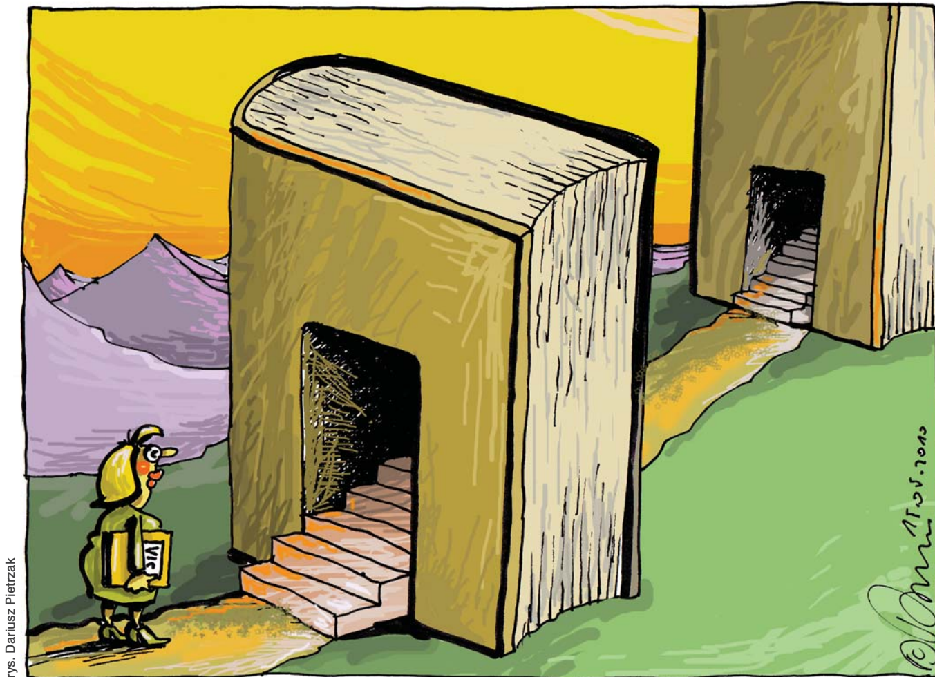
rys. Dariusz Pietrzak

Ważnym wskaźnikiem potencjału społecznego, sprzyjającego rozwojowi gospodarki opartej na wiedzy, jest chęć podwyższania wykształcenia i uzupełniania kwalifikacji przez pracowników. Podnoszenie kwalifikacji ma duży wpływ na karierę zawodową i zarobki.